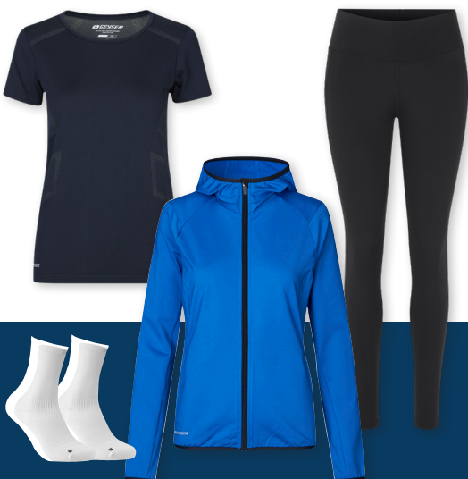
GEYSER T-shirt | seamless - No. G11020 GEYSER stretch hoodie - No. G11080 GEYSER performance tights - No. G11048 GEYSER stretch socks - No. G50000