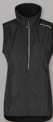
Running vest | light