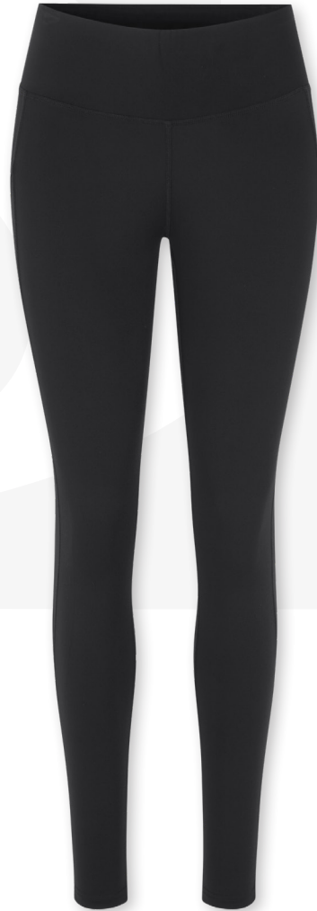
Damen: No. G11048 Herren: No. G21048