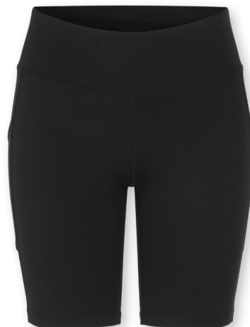
Damen: No. G11049 Herren: No. G21049