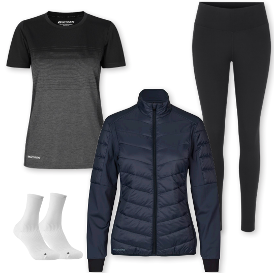
GEYSER striped T-shirt | seamless - No. G11024 GEYSER hybrid jacket - No. G11033 GEYSER performance tights - No. G11048 GEYSER stretch socks - No. G50000