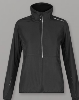
Running jacket | light