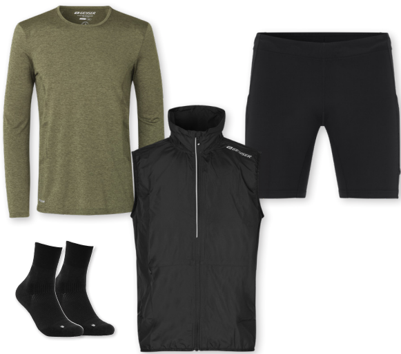
GEYSER long-sleeved T-shirt - No. G21021 GEYSER running vest | light - No. G21014 GEYSER performance tights | short - No. G21049 GEYSER stretch socks - No. G50000