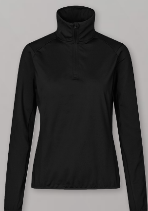
Stretch trainer | ¼ zip