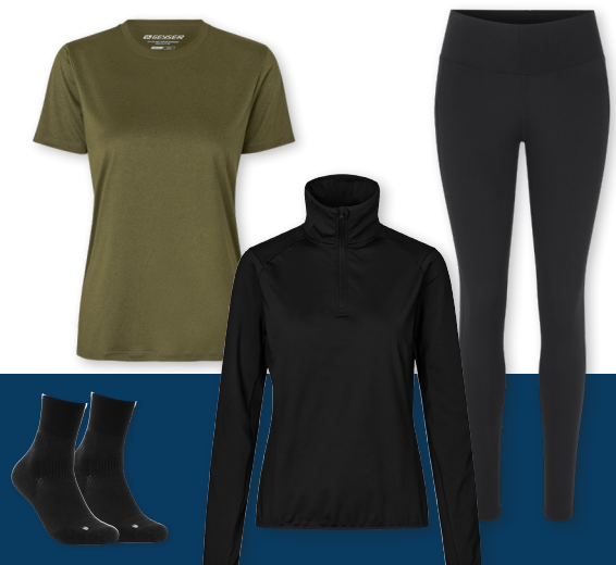
GEYSER T-shirt | essential - No. G11040 GEYSER stretch trainer | 1/4 zip - No. G11090 GEYSER performance tights - No. G11048 GEYSER stretch socks - No. G50000